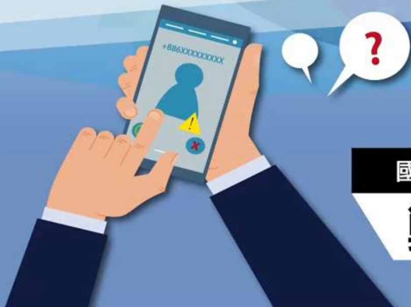
國立中山大學校長 鄭英耀