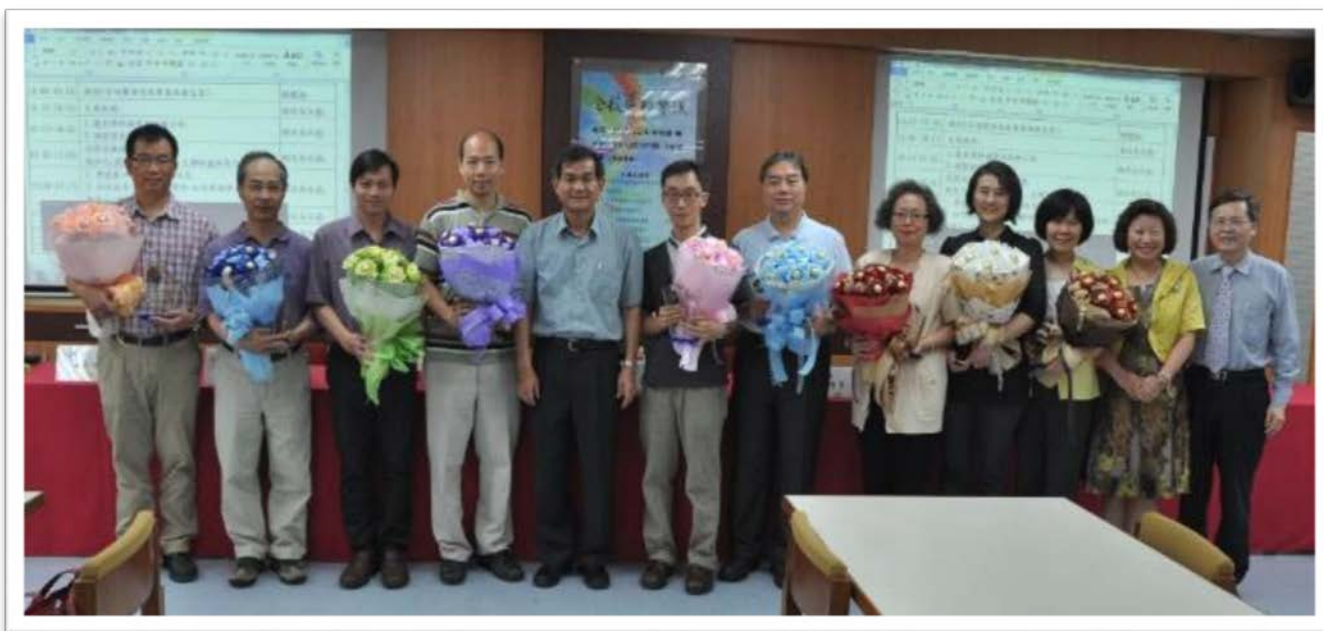
102學年度優良導師(於全校導師會議中頒獎)