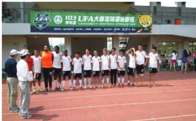
中華民國大專院校103學年度足球運動聯賽 獲得一般男子團體組全國第五名 賽後團體合影

四、「中華民國大專校院103學年度足球運動聯賽」一般男生組，於3月15～17日在崑山科技大學比賽，本校足球隊獲得一般團體組全國第5名。