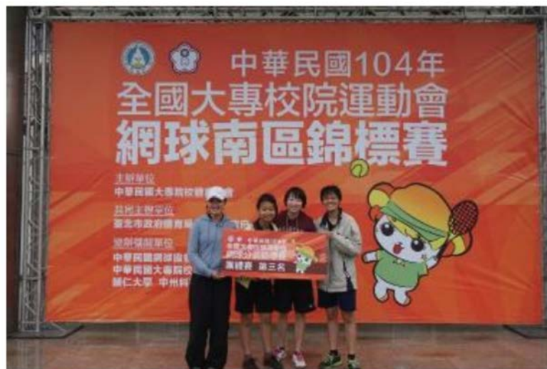
中華民國104年全國大專校院運動會 女子網球-南區錦標賽 獲得一般女子團體組預賽季軍

二、本校男子、女子網球代表隊於3月11~12日參加「中華民國104年全國大專校院運動會」南區錦標賽，在高雄市立陽明網球中心比賽，分別獲得一般男子團體組及一般女子團體組預賽季軍，並將於5月份至樹林體育場參加全國決賽。