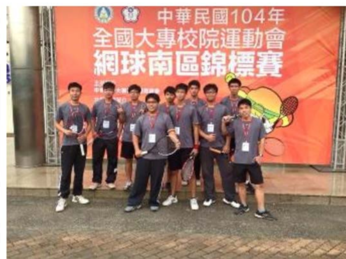
中華民國104年全國大專校院運動會 男子網球-南區錦標賽 獲得一般男子團體組預賽季軍