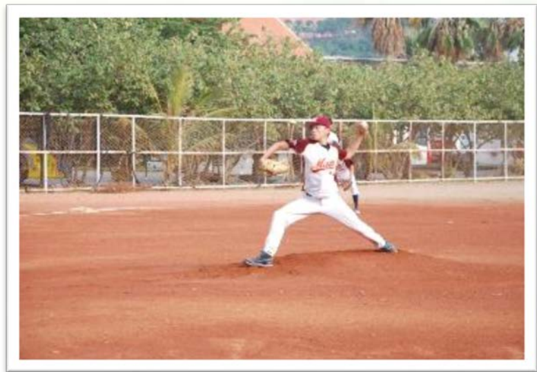
棒球賽-投手投球瞬間