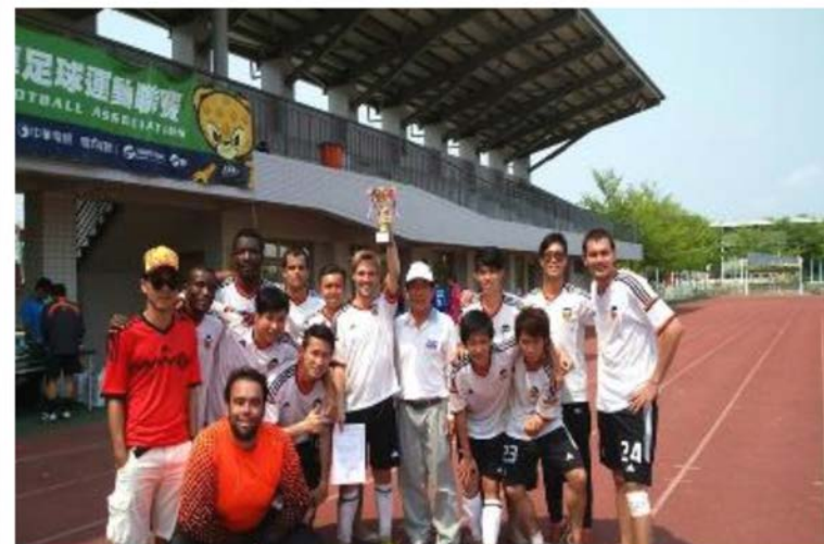
中華民國大專院校103學年度足球運動聯賽 獲得一般男子團體組全國第五名 賽後團體合影