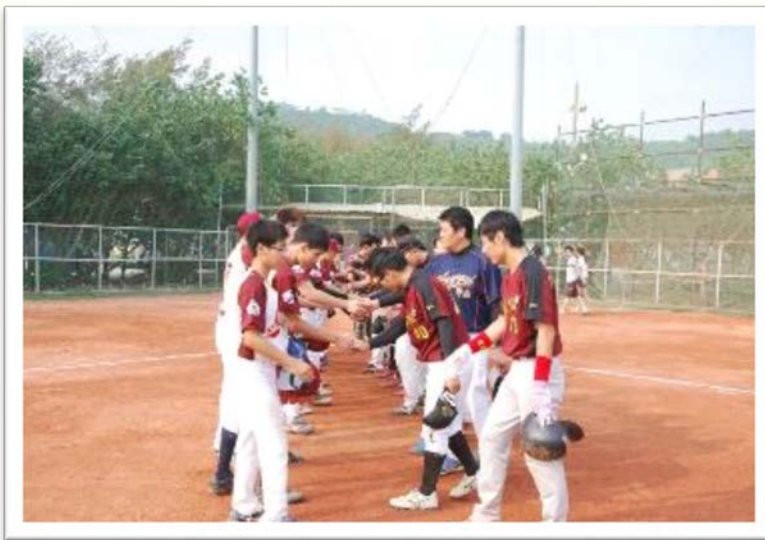
棒球賽-比賽開始，兩隊敬禮握手

本(103)學年度系際盃各項運動競賽於3月份陸續展開，項目計有：網球、棒球、桌球、排球、籃球、射箭、羽球、游泳、足球，共計9項。