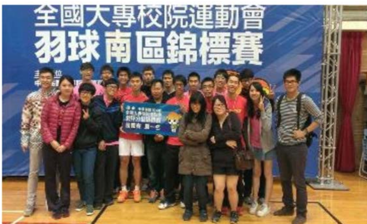
中華民國104年全國大專校院運動會 男子羽球-南區錦標賽 獲得一般男子團體組預賽冠軍 賽後團體合影

一、本校男子羽球代表隊於104年3月11~13日參加「中華民國104年全國大專校院運動會」南區錦標賽，在本校體育館三樓綜合球場比賽，獲得一般男子團體組預賽冠軍，並將於104年5月份至台北新莊體育場參加全國決賽。